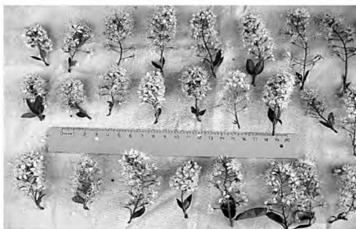
Рис. 1. Различные образцы соцветий вишни Маака Новосибирской популяции Fig. 1. Inflorescences of different samples in the Novosibirsk population of Prunus maackii Rupr.