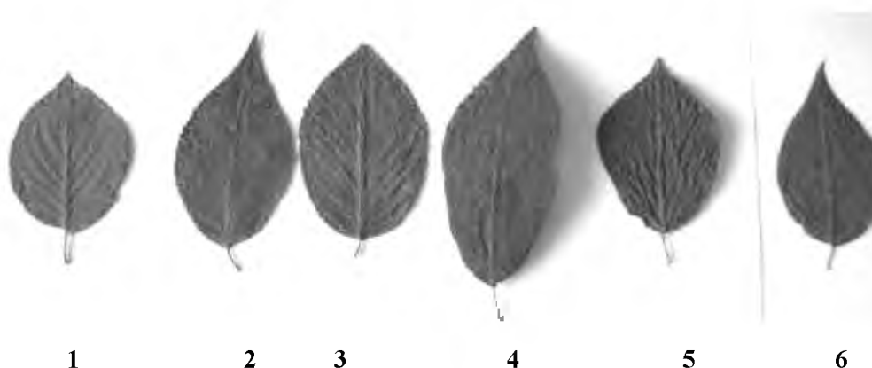
Рис. 3. Форма листовой пластинки вишни Маака

сторон. Существует значительное разнообразие формы листовой пластинки у различных видов косточковых растений. Этот признак может варьировать как в зависимости от расположения самой широкой части листа на листовой пластинке, так и от степени ее вытянутости. При исследованиях нами выявлено большое разнообразие по форме листовой пластинки и выделено шесть групп: 1 – овальная; 2 – удлинненно-овальная; 3 – широкоовальная; 4 – удлинненно-обратно-яйцевидная; 5 – обратно-яйцевидная; 6 – удлинненно-яйцевидная.