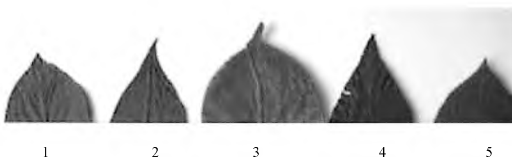
Рис. 4. Форма верхушки листовой пластинки

1 – oval; 2 – oblong-oval; 3 – broadly oval; 4 – oblong-obovate; 5 – obovate; 6 – ovate