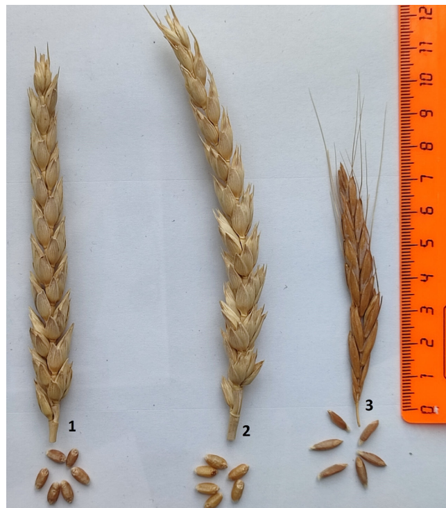
Рис. 1. Колосья и зерновки: 1 – сорт яровой мягкой пшеницы ‘Добрыня’ (♀); 2 – линия GEN2021-512; 3 – Triticum ispahanicum Heslot var. ispahanorufum Udachin (♂)