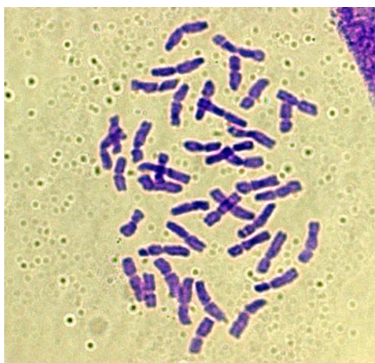
Рис. 2. Кариотип линии GEN2021-512

Note: PO19 – Omsk population, 2019; PS09 and PS20 – Saratov population, 2009 and 2020; TK1 – test clone, Chelyabinsk Province, 2019; TK2 – test clone, Tambov Province, 2016; TK3 – test clone, Krasnodar Territory, 2017