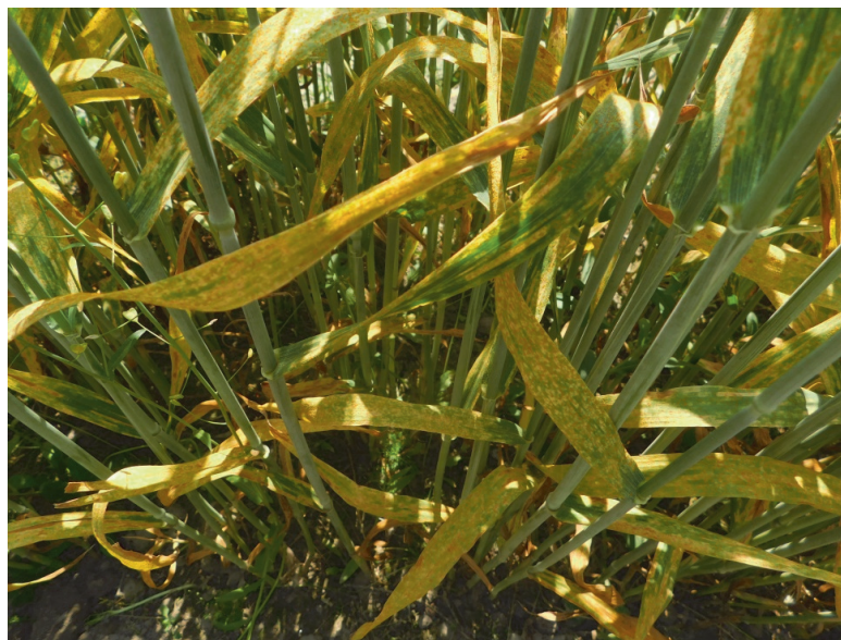
Рис. 1. Пораженность тритикале возбудителем желтой ржавчины на опытном поле ВИР в Пушкине (2020 г.)

Анализировали вирулентность 89 монопустульных изолятов патогена, в том числе 64 пушкинских (по 32 с мягкой пшеницы и тритикале) и 25 дербентских (15 с мягкой, 10 с твердой пшеницы). Ограниченная жизнеспособность урединиоспор P. striiformis в сухом гербарном материале, присланном в качестве инфекционного